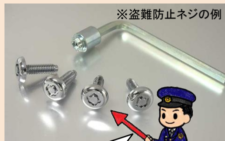
※盗難防止ネジの例